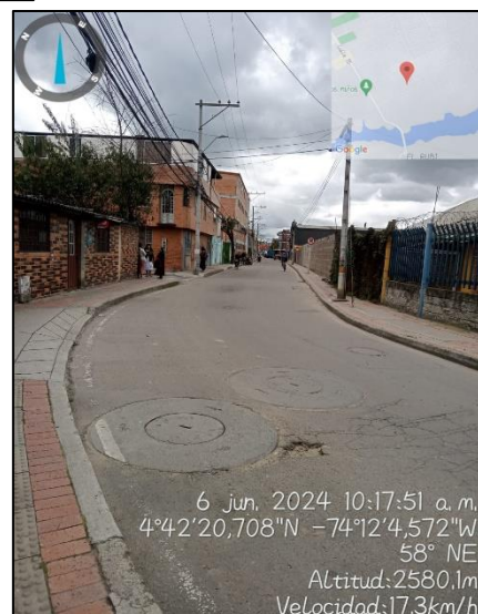
Ilustración 2. Recorrido por cuadrante